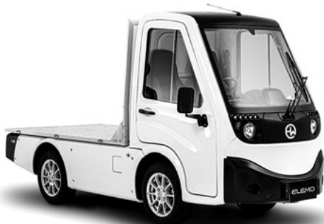
ELEMO 200 フラットベッド