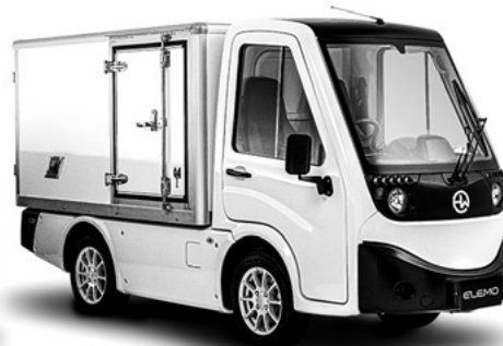
ELEMO 200 ボックス