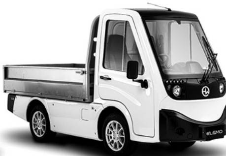
ELEMO 200 ピックアップ